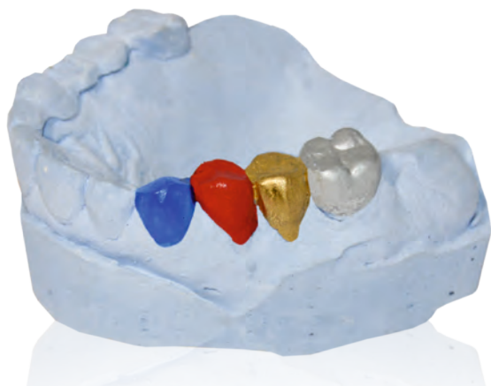
гипсовая модель с применением «ЗТ»-лаков различных цветов